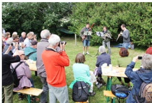
Das Konzert im Warftgarten

Die sechs kurzen Sätze des Divertissements für Trio d'anches von Erwin Schulhoff (1894-1942) konnten gute Laune zaubern. Mal hell, freundlich, schnell, schon fast jazzartig, dann wieder erzählend, tänzerisch mit bayrischen Melodien und auch japanisch anmutende Klangfolgen.