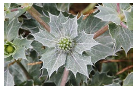
Mit ihrer graugrünen Farbe und den in Spitzen endenden Blättern ist die Stranddistel unverwechselbar.

Falls Sie an den Sandstränden zwischen Sylt und St. Peter-Ording eine Stranddistel sehen (nicht in den Dünen danach suchen!), teilen Sie den Standort bitte unseren Stationen vor Ort mit.