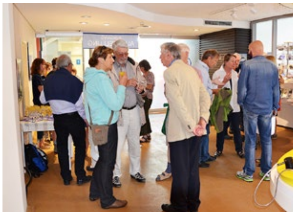
Beim Empfang im Nationalpark-Haus St. Peter-Ording

energiebedarf über Photovoltaik und Windenergie gedeckt werden kann. In diesem Jahr starte zwar die 20. große Klimakonferenz in Lima, die Welt werde aber nicht auf dem diplomatischen Parkett gerettet werden. Die Zivilgesellschaft