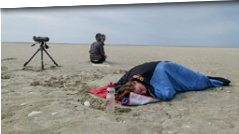
Nach der Zählung eine verdiente Mittagspause

Am ersten Mai war es endlich soweit. Zum ersten Mal dieses Jahr ging es zum Blauort-sand. Eigentlich sollten wir schon früher dort-hin laufen, aber es hat nie vom Wetter, den Veranstaltungen oder den Gezeiten gepasst. Obwohl wir uns alle vier darauf freuten, wie-der auf „unserer“ Sandbank zu sein, hatten wir ein komisches Gefühl im Magen, weil niemand genau wusste, wie und ob Blauort nach den Stürmen im vergangenen Herbst und Winter noch existiert (siehe auch »Wat-tenmeer« 1|2014).