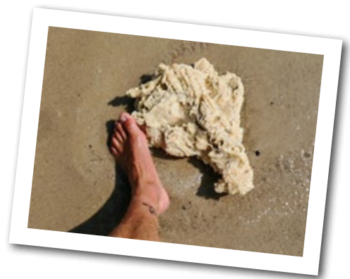
Mehrere Fußbälle passen locker in diesen Paraffin-klumpen, der im Frühjahr an die Sylter Küste trieb.