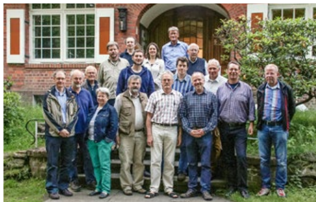
Erstes gemeinsames Vorstandstreffen der drei Umweltvereine

Alle drei Vereine bringen zusammen fast 250 Jahre Naturschutz Erfahrung in die Kooperation ein, die aber nicht immer spannungsfrei verliefen. Eine gute Voraussetzung für ein Gelingen ist daher das freundschaftliche Verhältnis, das Vorstandsmitglieder und Mitarbeiter seit vielen Jahren verbindet. ■