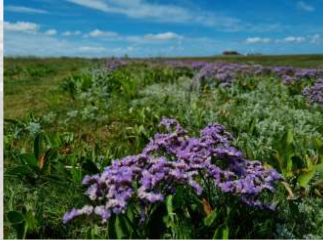
Halligflieder (steht unter Naturschutz)

Der Strand- oder Halligflieder hat seinen Namen nicht von ungefähr. Er blüht ganz besonders intensiv auf den breiten, etwas ruhigeren Halligen. Ebenso eine Hallig ist Nordstrandischmoor. Sie ist die jüngste Hallig in Nordfriesland und nur über den Lorendamm (nur von Einwohnern) oder über die Adlerschiffe, die nur sehr selten dort anlegen, zu erreichen. Doch genau zu dieser Hallig müssen die Freiwilligen des